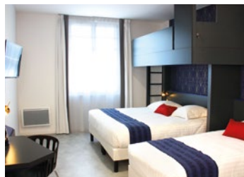
Exemple de chambre