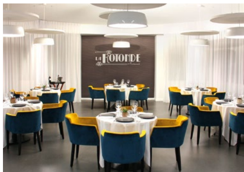
Restaurant 'La Rotonde'