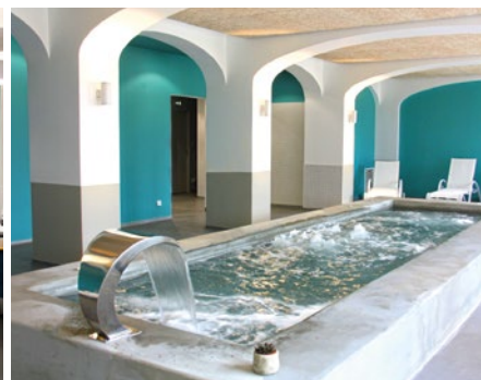
SPA 'Les Bains du Lac'