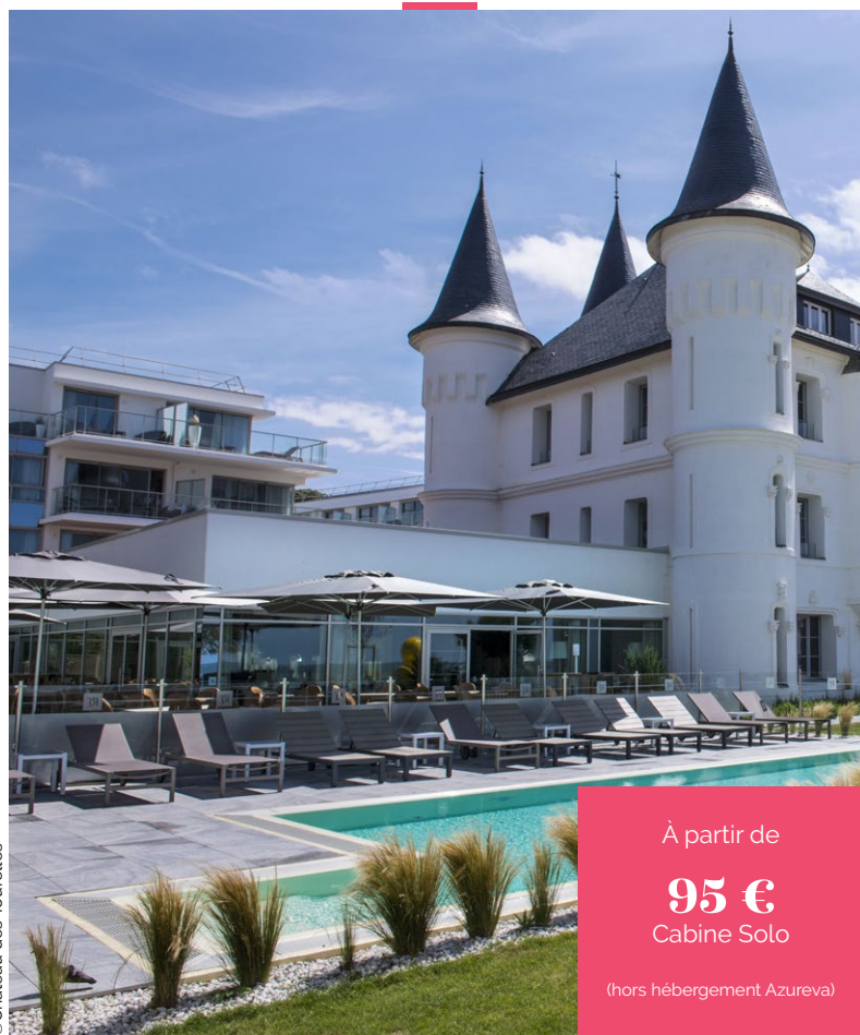
©Château des Tourelles